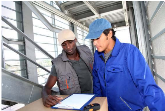
Mobilité transnationale afin d'enrichir l'expérience des travailleurs dans le secteur du transport et de la logistique

La communication entre l'apprenant et l'établissement d'accueil est également importante pendant la phase de mobilité. L'établissement d'accueil accompagne l'apprenant.