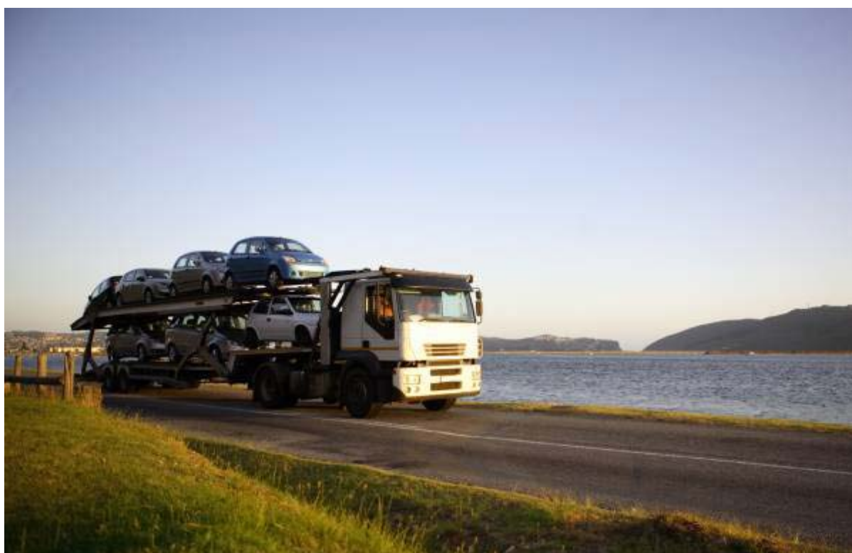
Assurance de qualité dans le secteur du transport et de la logistique

Tous les éléments de l'initiative ECVET sont disponibles sur le réseau. L'assurance de la qualité est une problématique importante au sein du réseau.